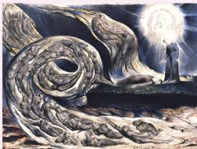
William Blake, The Lovers' Whirlwind illustrates Hell in Canto V of Dante's Inferno as recorded in Rev. 20:13 (1798)

世歷代一直在啟迪着各界人士，特別是藝術家：畫家、雕塑家、文學家、劇作家、舞蹈家、導演、詩人、甚至書法家。☞