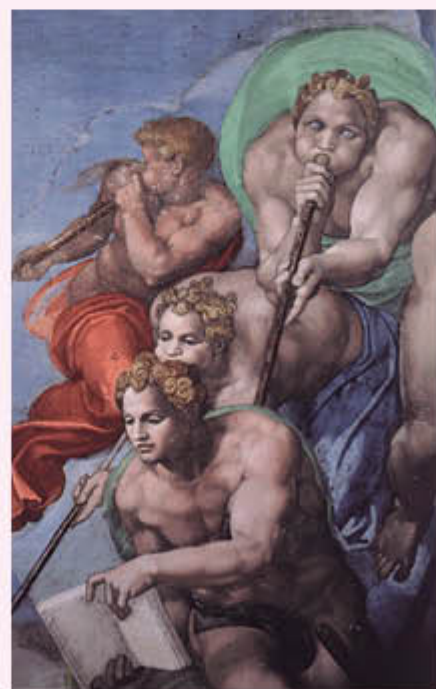
Michaelangelo, Angel, Trumpeting, and one with the Book of Life, Sistine Chapel, 1536-1541