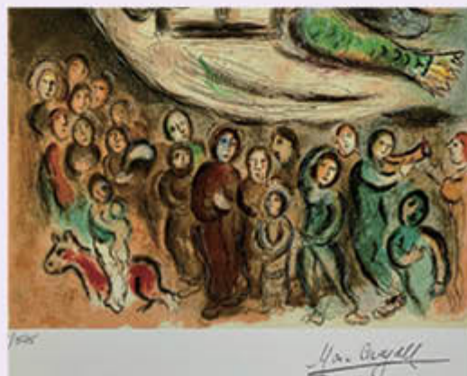
Marc Chagall, Moses shows the elders the Tablets of the Law, 1966