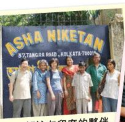
探訪在印度的夥伴

關心社會的心重燃了，但定位更實在的方向，卻要到2005年在香港舉辦的世貿會議。當時除了各國政要，不少外國的非政府組織在05年中起也來到香港開會，包括一些公平貿易組織，認識她們的工作及深入交流後，趙善榮於是想到富庶的香港也可以引入公平貿易，幫助那些被邊緣化的生產者。