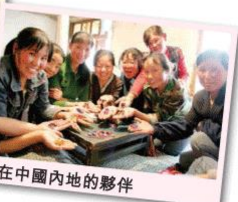
在中國內地的夥伴