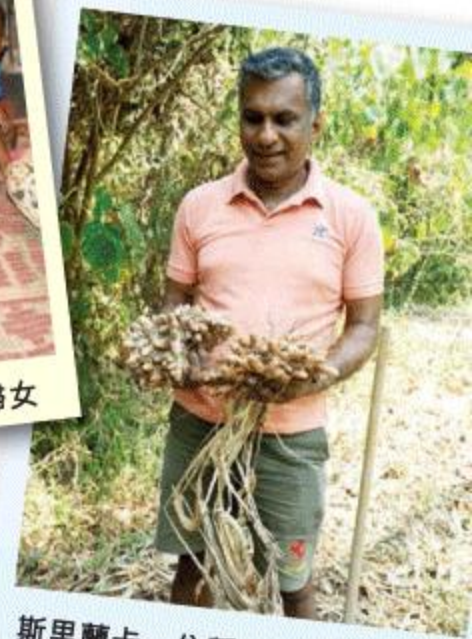
斯里蘭卡一位種植黃薑的農民