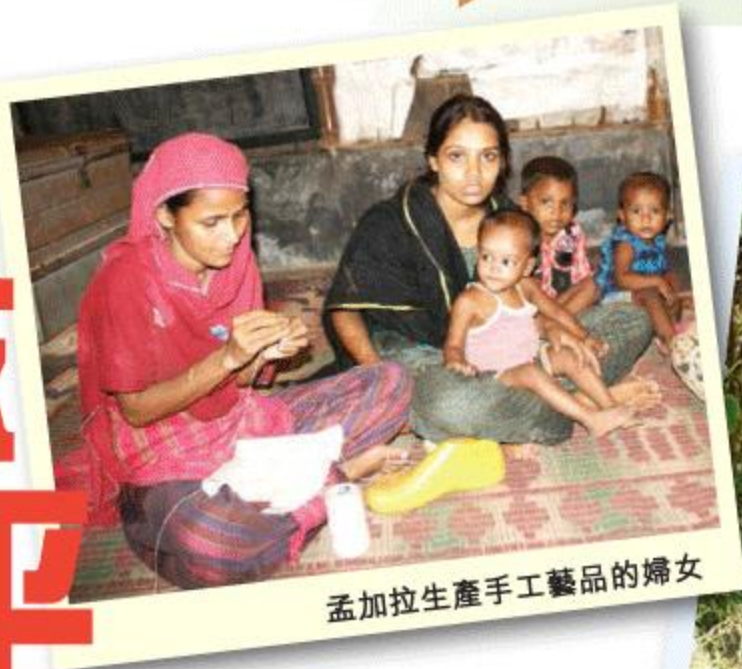
孟加拉生產手工藝品的婦女