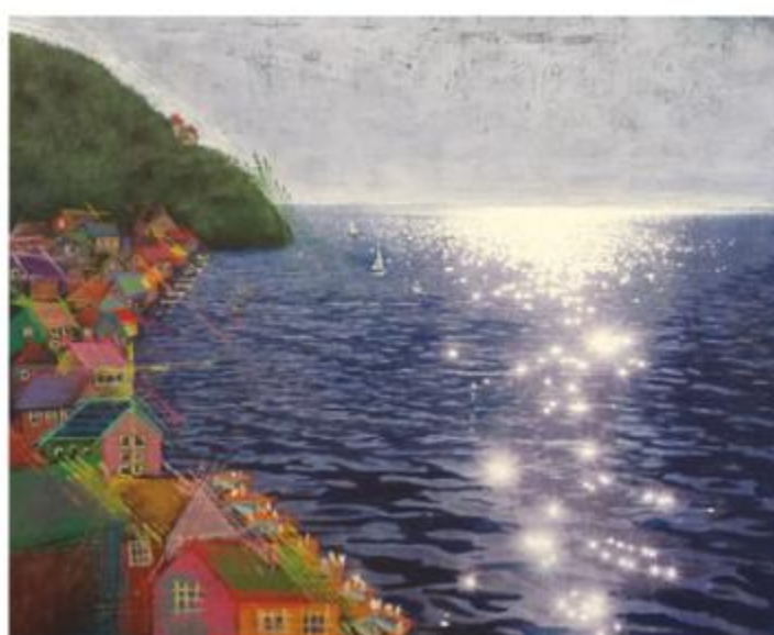
艾阮的文學繪本創作《給至親者的十封信》插圖·港灣

她再以《悲慘世界》為例：「我們讀鐮·巴路鐮，因為偷了一塊麪包而入獄十九年，得到主教的施恩，他後來成了一個善良的人，更幫助妓女芳婷養育她的女兒，但警察賈維窮追猛打，一心要拘捕他……我們就透過想像去感受他人的感受，去體諒人，去面對逆境，去批判不合理的權威，去辨別什麼是真善美。」