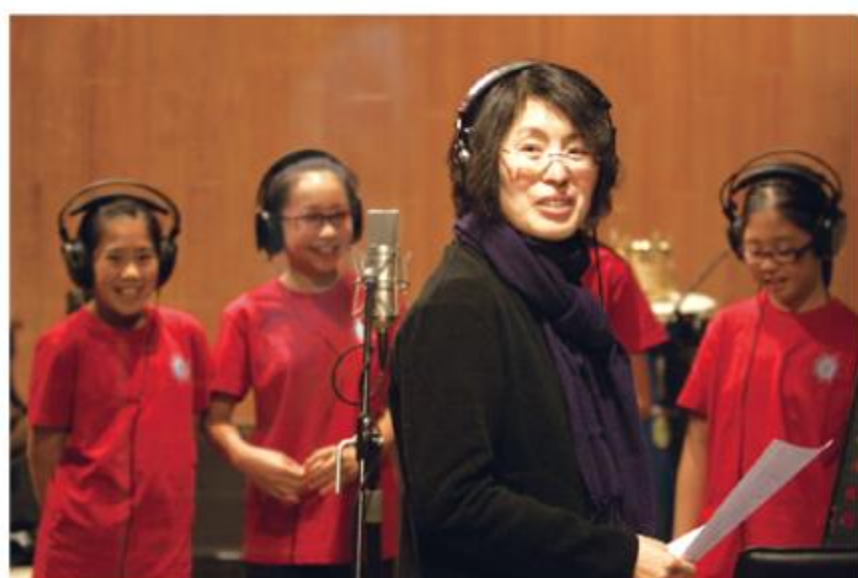
艾阮每每在音樂創作中表達她的深情

對人生、情感觸覺極其敏銳的艾阮，決定進入神學院尋求生命之道，甚至畢業後當過傳道人，但最後當上了創作人，用音樂、文學與藝術創作來觸摸一個個的靈魂。她從事音樂創作十多年，近幾年出版文學創作，兩本文學繪本《行在地上》及《給至親者的十封信》更先後獲得基督教湯清文藝獎（2012）及基督教金書獎（2015）。