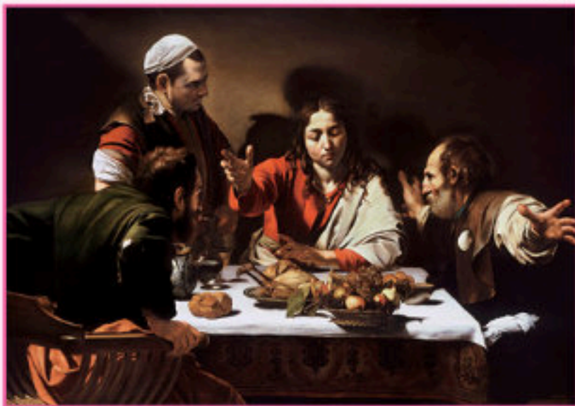
Caravaggio's Supper at Emmaus

同樣，敬拜聚會的音樂是誘發人默想永恆最好的媒介，尤其是實存的奧秘，如三一神的超越，因為只有音樂可稍為表述上帝的屬性。音樂也能激發人不同的感官，對人的情緒和身體的感應產生啟發作用。若果藝術與信仰缺乏在洞見與實體上的互動，雙方都會變得越來越貧乏。這樣的隔離狀態，必導致信仰在思想領域上的停滯；因為藝術啟迪真理，同時又能協助尋求真理。藝術的方式本身就是想像、聯想、扣連、立義。☞