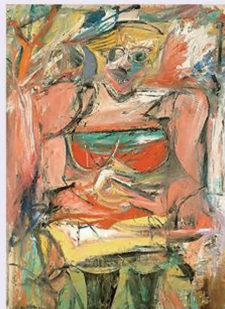
Willem DE KOONING Woman V 1952-53

對於亞伯蘭來說，平原城邑的繁榮，不及上主賜下後裔的興奮。亞伯蘭懷著對上主的信心，勇敢的凝望著上主應許的將來，住在迦南地猶如活在伊甸園。他堅毅的在上主不變的信實之統率下，面對一個個生命的挑戰——倒楣到極處，便是幸福的極處。惡劣與醜是一種背景，用來增強人生美的光輝。☞