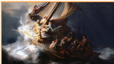
Rembrandt, Christ In The Storm On The Sea Of Galilee, 1633.

聖靈叫各式各樣的人能活現不同的恩賜(林前十二7-13)。正如出30:1-6說：「耶和華曉諭摩西說……烏利的兒子比撒列，我已經題他的名召他。我也以我的靈充滿了他，使他有智慧，有聰明，有知識……；又能刻寶石，可以鑲嵌，能雕刻木頭，能作各樣的工……。凡心裏有智慧的，我更使他們有智慧，能作我一切所吩咐的。」請留意被聖靈充滿的是兩位沙漠藝術家，他們與生俱來已有藝術的智慧，但聖靈更加添他們屬天的智慧，以配合上帝的藝術要求。☞