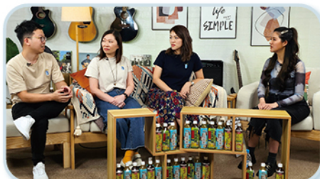
早前受訪嘉賓：樂隊玻璃海